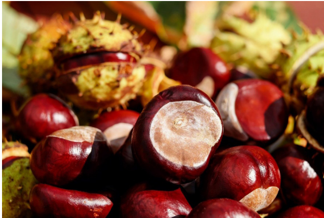
Кестенови као алузија на Улицу дивљих кестенова

„Чули сте, куће нема. [...] Соба мог детињства претворила се у леју са луком, а на месту где је стајала сингерица моје мајке – бокор ружа. Поред баште се уздиже нова троспратница, у њој станује професор Смердел. Кестенове су посекли, рат, људи или просто – време.” (Киш 2021: 9)