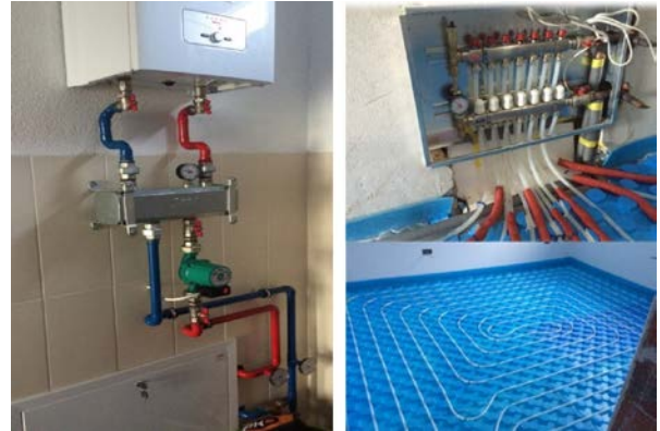
Slika 2. Prikaz sistema grejanja sa električnim kotlom i podnim razvodom

prostorijama manje od 60 W/m 2 , pa je podno grejanje opravdano izabran sistem. Regulacija temperature se vrši pomoću jednog sobnog termostata, pozicioniranog u najvećoj prostoriji u centralnom delu kuće.