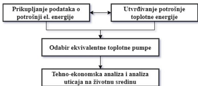
Slika 1. Šematski prikaz predložene metodologije

Predložena metodologija se sastoji iz tri faze prikazane na slici 1. U okviru prve faze, u zavisnosti od sistema grejanja, tj. u zavisnosti od toga koji se energent primarno koristio za zagrevanje objekta, moguće je na više načina utvrditi potrošnju toplotne energije.