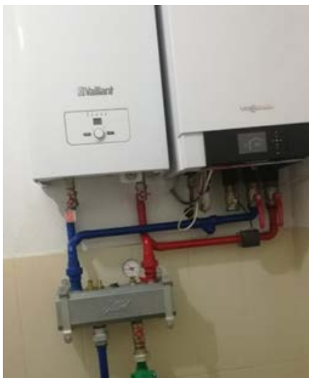
Slika 4. Prikaz toplotne pumpe i električnog kotla u kaskadi

Sa slike se može videti da je u najhladnijim zimskim mesecima potrošnja električnog kotla veća od 2.000 kWh, što nije slučaj u prelaznom periodu (oktobar, novembar, april i maj) kada je potrošnja elektro kotla i više od dvostruko manja. Kao što je već bilo reči, uzimajući u obzir tarifni sistem naplate električne energije u Srbiji, potrošnja iznad 1.600 kWh mesečno značajno utiče na srednju cenu električne energije, pa je tako na primer srednja cena električne energije u letnjim mesecima u proseku oko 7 RSD/kWh, dok je u zimskim mesecima i do 12 RSD/kWh. Shodno tome, investiranje u sistem grejanja kojim bi se