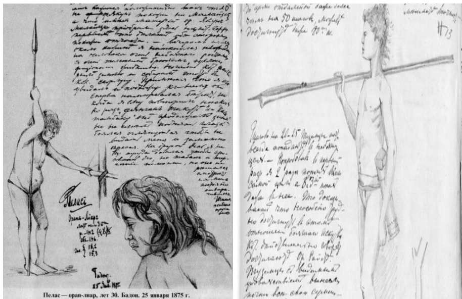
Фотографија 2. Маклајеви цртежи и белешке, Пела, 1875. 7