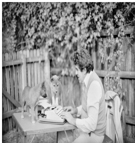
Фотографија 3. Миклухо-Маклај у Квинсленду, 1880. 11