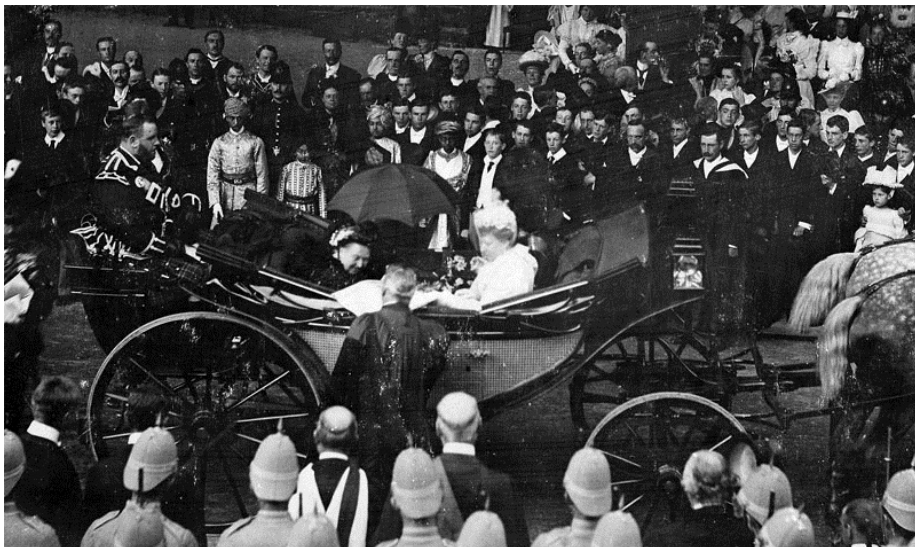
Краљица Викторија током Дијамантског јубилеја

дигне поглед и наклони се. Онда се насмешила и климнула оном јадном старом главом” (1990: 103, 105). Као посебан куриозитет, један од фотографа успео је да забележи несвакидашњу прилику коју помиње Вирџинија Вулф: призор краљице Викторије која се смеши.