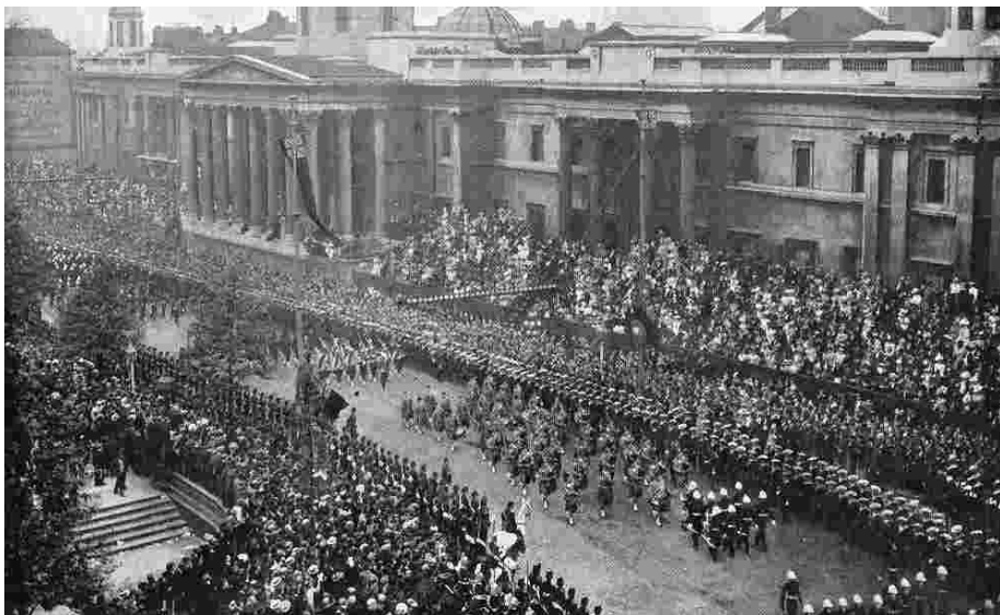
Шкотски гајдаши и колонијалне трупе испред Народне галерије

тижеља у вези са колонијалним војницима, иако они нису нужно били прихваћени као интегрални део империјалног грађанства. 14