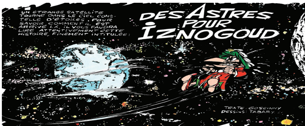
Визуелни приказ 1 Iznogoud © 1969 Dargaud

Панел, попут овог, у којем Изногуд посматра космичко ноћно небо, очаран звездама, кључан је за приказивање његових амбиција. Визуелни приказ звезда које се огледају у његовим очима истиче његову жудњу за славом, док контраст између тамне ноћи и звезданог сјаја наглашава његову жељу за достизањем нечег узвишеног и за превазилажењем граница овоземаљског. Дакле, целокупна нарација ослања се и почива на визуелном језику како би истакла јачину Изногудове опсесије. Представљена сцена репрезентативан је пример Изногудове упорности и карактеристичан пример хумора у овом стрипу. Њоме се, такође, истиче живописност и хаотична природа самог наратива. Аутори су, на хумористичан начин, истакли Изногудову ограниченост делања, а комични ефекат постигнут је диспропорцијом Изногудових амбиција и његове неспособности да их оствари.