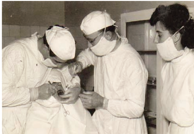
Слика 4. Хируршка интервенција